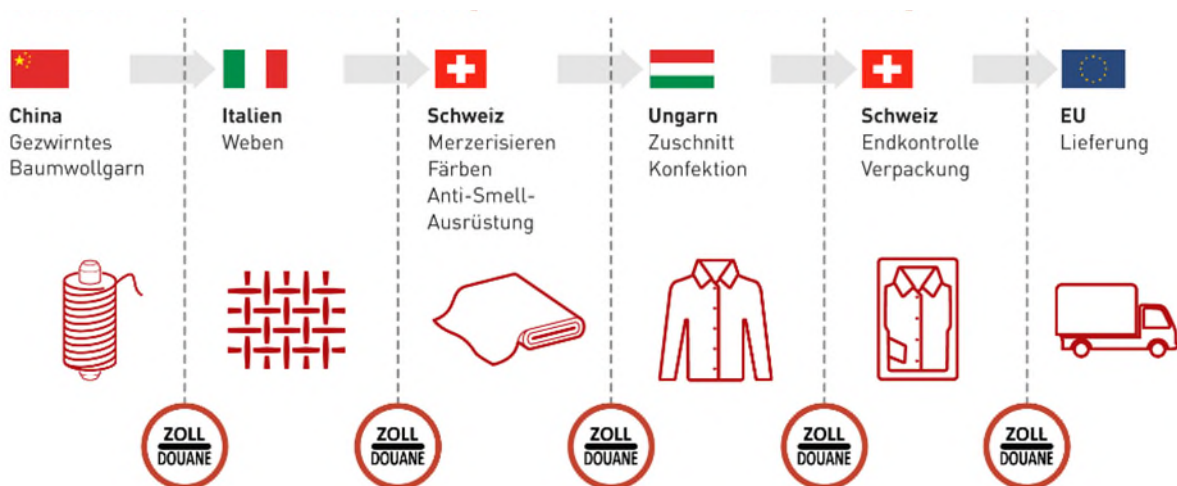
Abbildung 1 Lieferkette eines Hemdes.

Die Globalisierung ist aber nicht nur in der Wirtschaft bemerkbar, sondern auch in vielen anderen Bereichen, wie z.B. der Politik, Kultur, oder persönliche Kontakte / Netzwerke.