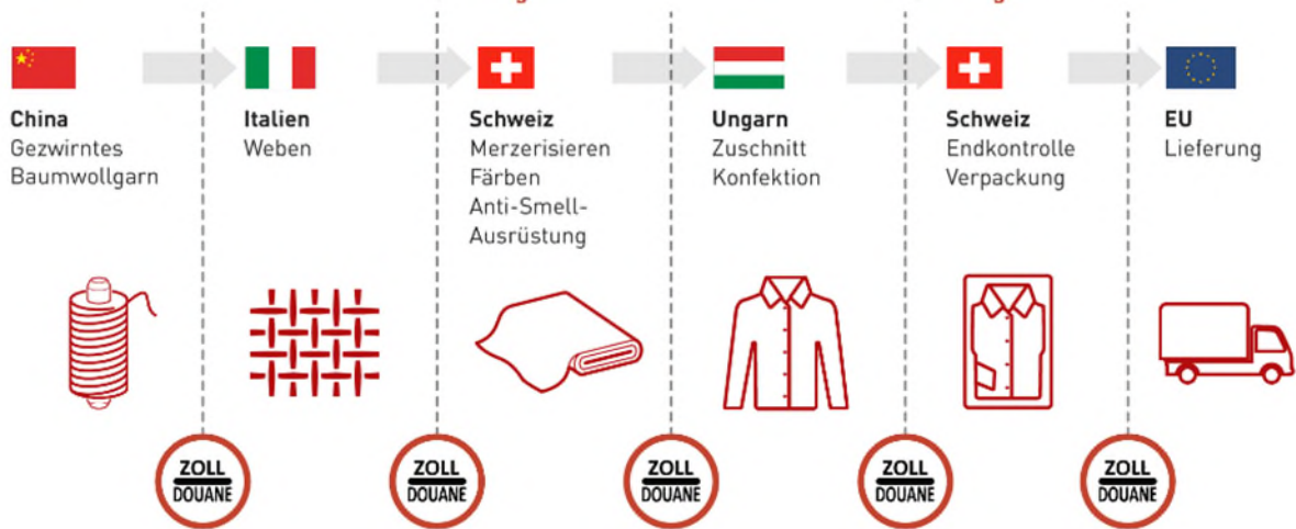
Abbildung 2 Lieferkette eines Hemdes.