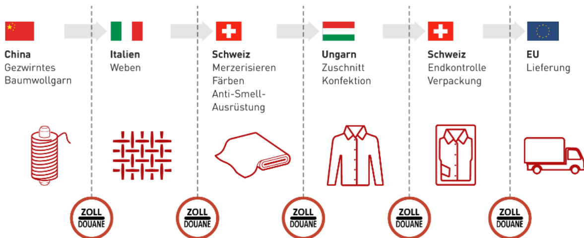
Abbildung 1 Lieferkette eines Hemdes.

Die Globalisierung ist aber nicht nur in der Wirtschaft bemerkbar, sondern auch in vielen anderen Bereichen, wie z.B. der Politik, Kultur, oder persönliche Kontakte / Netzwerke.